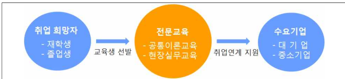
<바이오인력양성 프로그램 구조>